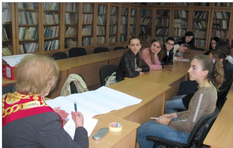
63 U ovom dijelu smo razgovarali o izlascima i imaju li ograničenja kad su oni u pitanju.

Momcima su uzori uglavnom očevi, te nastoje da budu što sličniji njima. U jednom od gradova, čak sedam dječaka je izabralo majku kao uzor. Ipak, na pitanje o kažnjavanju partnerke, gotovo svi ispitanici iz tog grada su se izjasnili pozitivno. Dakle, realno je postaviti pitanje o motivima identifikacije sa majkom. Da li oni priželjkuju osobine majke za svoju partnerku, kako bi je mogli kažnjavati, ili im